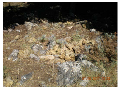
5. Συλλογή τσαγιού

Το Δασαρχείο Σπάρτης είναι αρμόδιο για την περιοχή του Πάρνωνα που φύεται το τσάι και σε συνεργασία με τους φύλακες του Φ.Δ. προσπάθησαν να αποτρέψουν την αλόγιστη συλλογή και εμπορία του. Με την αλλαγή του ωραρίου των φυλάκων κατά τη περίοδο συγκομιδής του – μήνες Μάιος με Αύγουστο – αλλά και με συγκεκριμένα εβδομαδιαία δρομολόγια, στις περιοχές του Πάρνωνα όπου φύεται, οι φύλακες κατάφεραν να αποτρέψουν τέτοια περιστατικά. Συνολικά καταγράφηκαν μόνο τρία, από τα οποία στο ένα έγινε κατάσχεση τεσσάρων τσουβαλιών τσαγιού από το δασοφύλακα (Δασαρχείου Κυνουρίας) της περιοχής του Αγίου Πέτρου.