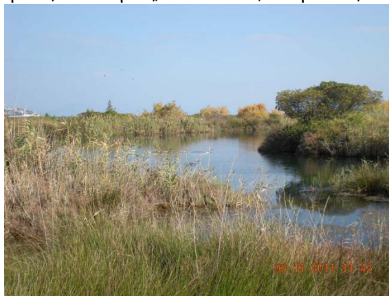
2. Υγρότοπος Μουστού

Α. Περιοχές Απόλυτης προστασίας της Φύσης: εξαιρετικά ευαίσθητα οικοσυστήματα, βιότοποι ή οικότοποι σπάνιων ή απειλούμενων με εξαφάνιση ειδών της αυτοφυούς χλωρίδας ή της άγριας πανίδας, εκτάσεις που έχουν αποφασιστική θέση