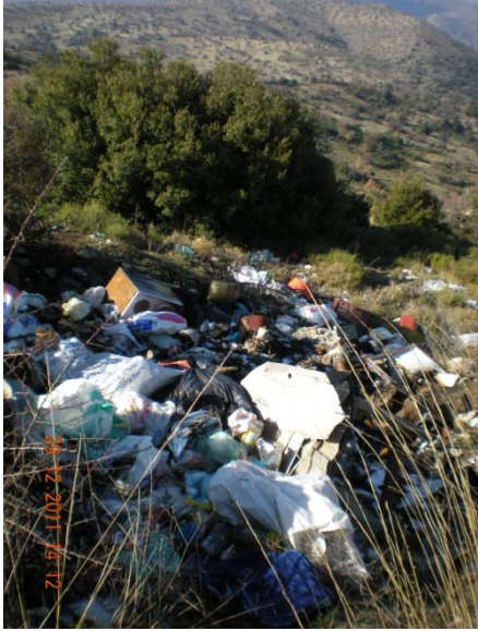
9. Ρίψεις απορριμμάτων

Λαθροθηρία: Τα επτά καταφύγια Άγριας Ζωής που υπάρχουν στην περιοχή του Φ.Δ. κάνουν ιδιαίτερα δύσκολο το έργο των φυλάκων αλλά μέχρι και σήμερα δεν έχει εμφανιστεί κάποιο ιδιαίτερο κρούσμα λαθροθηρίας. Η πολύ καλή συνεργασία με τη θηροφυλακή και τους κυνηγητικούς συλλόγους καθώς και οι συνεχείς περιπολίες βοήθησε αρκετά στη πρόληψη και καταστολή της λαθροθηρίας. Ένα μειονέκτημα του Φ.Δ., πέραν της ελλιπέστατης νομοθεσίας περί αρμοδιοτήτων, είναι το ωράριο εργασίας, το οποίο δεν είναι δυνατόν να εκτελείται κατά τις νυχτερινές και πρώτες πρωινές ώρες. Αυτό έχει ως αποτέλεσμα να μην έχουν εντοπιστεί κρούσματα λαθροθηρίας, ενώ είναι γνωστό ότι υπάρχουν, κυρίως τις νυχτερινές ώρες.