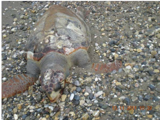
10. Νεκρή Caretta caretta

Μία από τις βασικές αρμοδιότητες του Τμήματος Φύλαξης αποτελεί και η Καταγραφή και Παρακολούθηση ειδών, στα πλαίσια της συμμετοχής του στο Πρόγραμμα Καταγραφής & Παρακολούθησης ειδών και τύπων οικοτόπων, στην περιοχή ευθύνης του Φορέα.