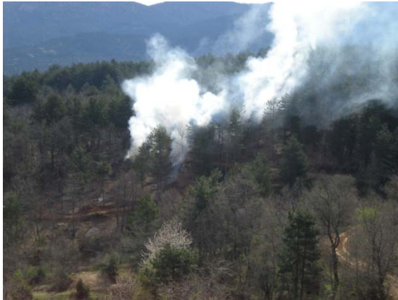
4. Πυρκαγιά στον Πάρνωνα

Οι πυρκαγιές και κυρίως η πρόληψη τους, είναι ένα σημαντικό κομμάτι με το οποίο ασχολούνται οι φύλακες του Φ.Δ τόσο στις ορεινές περιοχές του Πάρνωνα όσο και στις πεδινές. Κατά την περίοδο αυτή διαμορφώνεται κατάλληλα ο εξοπλισμός των οχημάτων φύλαξης με βυτία πυρόσβεσης, χωρητικότητας 500 λίτρων νερού και μάνικες κατάσβεσης.