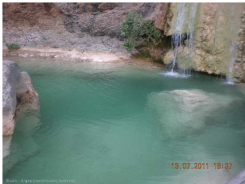
1. Καταρράκτης Λεπίδας

είναι πολύ σημαντικές καθώς περιλαμβάνουν τέσσερα στενά ενδημικά είδη της χλωρίδας, που απαντούν μόνο σ' αυτήν την περιοχή, και πολλά είδη σπάνιων χασμόφυτων.