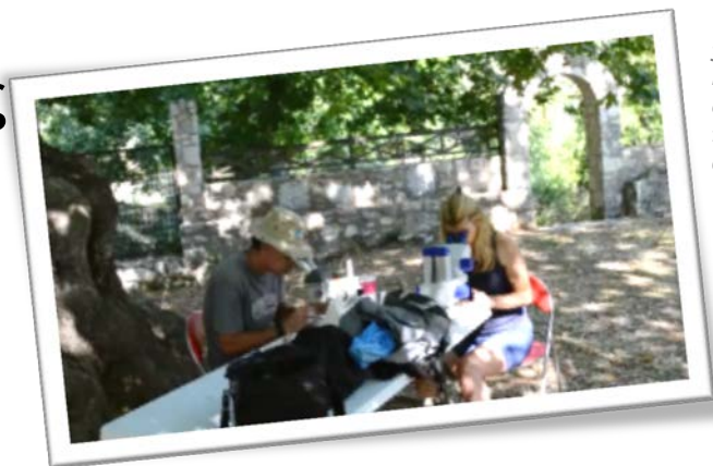
30.7.2015 Εργασία πεδίου στη θέση Πρόδρομος στον Άγιο Ιωάννη Αρκαδίας, στο πλαίσιο του έργου "Καταγραφή και παρακολούθηση των ειδών ασπόνδυλων".

Συγκεκριμένα, πραγματοποιήθηκε εργασία στην πορεία υλοποίησης και ολοκλήρωσης της Γ' Φάσης και της έναρξης της Δ' Φάσης των περισσότερων προγραμμάτων παρακολούθησης, κατά τη διάρκεια του Β τετραμήνου το προσωπικό του Φ.Δ.εργάστηκε σε δύο άξονες. Στον πρώτο άξονα, η Επιτροπή Παραλαβής των έργων προέβηκε στον έλεγχο και τις διορθώσεις των παραδοτέων των αναδόχων και την οριστική παραλαβή των τελικών παραδοτέων Ενδιάμεσης Έκθεσης Φάσης Υποέργου ή και Λήξη Φάσης Υποέργου. Ο δεύτερος άξονας