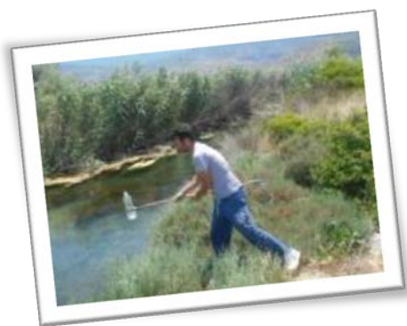
15.6.2015 Λήψη δειγμάτων νερού από το Βαυαρικό κανάλι του υγροτόπου Μουστού.

συμβασιοποιήθηκε η παροχή υπηρεσιών στις 08.09.2014.