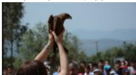
7.5.2015 Εκδήλωση απελευθέρωσης άγριας ορνιθοπανίδας στο Γεράκι Λακωνίας

ενός βραχοκίρκινεζου ( Falco tinnunculus ), που μεταφέρθηκαν στην περιοχή ειδικά για το σκοπό αυτό. Τα άγρια πτηνά είχαν περισυλλεχθεί τραυματισμένα και φιλοξενούνταν στις εγκαταστάσεις της «ANIMA», όπου και αποθεραπεύθηκαν, εωσότου ήταν υγιή και ικανά να αφεθούν ελεύθερα στο φυσικό τους περιβάλλον.