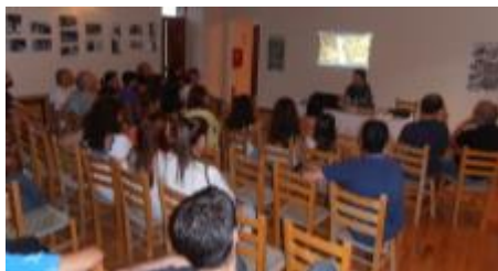
4 η εκδήλωση «Συμπολιτεία του Πάρνωνα» στον Χάραδρο Αρκαδίας

από 3 έως 15.8.2015, στο παραδοσιακό τσακωνοχώρι του Πάρνωνα, για 8 η χρονιά. Περιλάμβαναν μία ενημερωτική ομιλία για τα φαράγγια του Πάρνωνα, αλλά και περιβαλλοντικές δραστηριότητες και ομαδικά παιχνίδια στην πλατεία του χωριού για τα παιδιά με κληρώσεις αναμνηστικών δώρων του Φ.Δ.. Το προσωπικό του Φ.Δ. υποδέχθηκε πολλούς επισκέπτες και κατοίκους της ππ στους χώρους του ΚΠΕ Καστάνιτσας, όπου όλοι είχαν την ευκαιρία να ενημερωθούν για την σημαντική βιοποικιλότητα της ππ, τα φυσικά μνημεία, τη διαχρονική συνύπαρξη του ανθρώπου με την φύση, την αρχιτεκτονική του χωριού και τα αξιοθέατά του. Οι επισκέψεις πλαισιώθηκαν με τη διανομή ενημερωτικών (φυλλάδια, χάρτες της ππ, κ.α.).