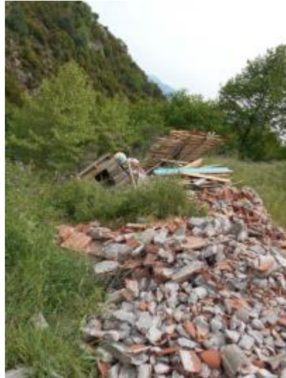
21.5.2015 Ρίψη απορριμμάτων & μπαζών στη Μεσοράχη Αρκαδίας.

Αξιζει να σημειωθεί ότι η φύλαξη της περιοχής παρουσίασε σημαντικές ελλείψεις κατά το διάστημα του 2 ου τετραμήνου του έτους λόγω ανεπάρκειας καυσίμων εξ' αιτίας της επιβολής των τραπεζικών Capital Controls. Ως αποτέλεσμα τα οχήματα φύλαξης δεν κινήθηκαν επί αρκετές ημέρες της εν λόγω περιόδου.