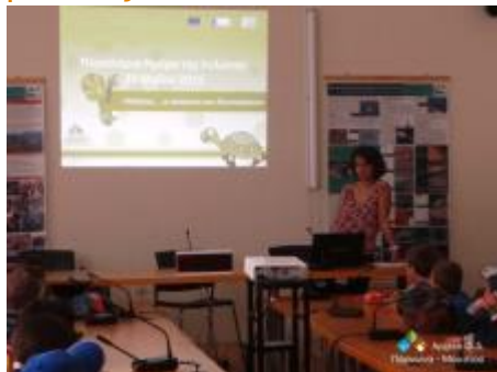
22.5.2015: Παγκόσμια Ημέρα της Χελώνας στο Κέντρο Περιβαλλοντικής Ενημέρωσης Άστρους

Ο Φ.Δ. διοργάνωσε, κατά το 2 ο τετράμηνο του 2015, επισκέψεις περιβαλλοντικής ενημέρωσης σε σχολεία, με στόχο, την ενημέρωση και την ευαισθητοποίηση μαθητών και εκπαιδευτικών γύρω από περιβαλλοντικά θέματα. Οι επισκέψεις πραγματοποιήθηκαν σε 7 σχολεία εντός και πλησίον της προστατευόμενης περιοχής, και συνολικά ενημερώθηκαν περίπου 455 μαθητές .