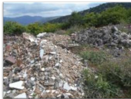
8.6.2015 Απορρίμματα & μπάζα στην περιοχή του γηπέδου στον Άγιο Πέτρο Αρκαδίας.

Αξιζει να σημειωθεί ότι η φύλαξη της περιοχής παρουσίασε σημαντικές ελλείψεις κατά το διάστημα του 2 ου τετραμήνου του έτους λόγω ανεπάρκειας καυσίμων εξ' αιτίας της επιβολής των τραπεζικών Capital Controls. Ως αποτέλεσμα τα οχήματα φύλαξης δεν κινήθηκαν επί αρκετές ημέρες της εν λόγω περιόδου.