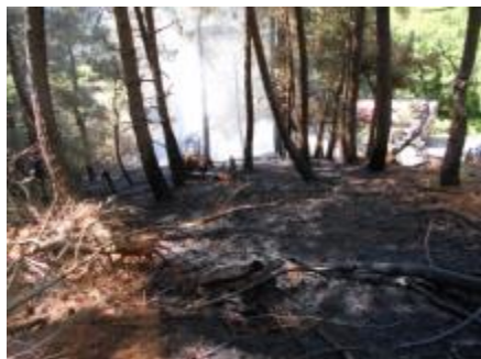
26.6.2015 Κατάσβεση πυρκαγιάς στην περιοχή Αγίου Πέτρου Αρκαδίας.

Η άσφηση συνεργασία με το Πυροσβεστικό Σώμα Αρκαδίας και Λακωνίας επέφερε θετικά αποτελέσματα στην αποτροπή ή/και στην άμεση επέμβαση στα περιστατικά πυρκαγιών, με αποτέλεσμα η έκταση αυτών να είναι ιδιαίτερα περιορισμένη.