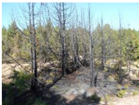
20.8.2015 Καμένη έκταση στην περιοχή Ταρμίρι Αγίου Πέτρου Αρκαδίας.

Η άσφηση συνεργασία με το Πυροσβεστικό Σώμα Αρκαδίας και Λακωνίας επέφερε θετικά αποτελέσματα στην αποτροπή ή/και στην άμεση επέμβαση στα περιστατικά πυρκαγιών, με αποτέλεσμα η έκταση αυτών να είναι ιδιαίτερα περιορισμένη.