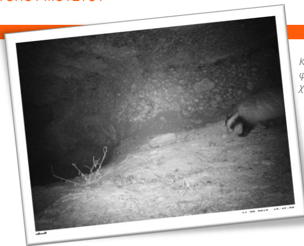
Καταγραφή πανίδας με αυτόματες φωτογραφικές μηχανές στη θέση Ρέμα χειμάρρου Τάνου: Ασβός ( Meles meles )