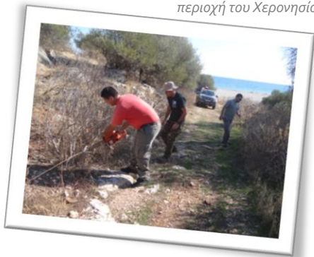
Φωτο: 24.10.2013 Καθαρισμός μονοπατιού στη περιοχή του Χερωνησίου

Η άψογη συνεργασία με το Πυροσβεστικό Σώμα Αρκαδίας και Λακωνίας, επέφερε σημαντικότερα αποτελέσματα στην αποτροπή και άμεση επέμβαση στα περιστατικά πυρκαγιών, με αποτέλεσμα η έκταση αυτών, να είναι ιδιαίτερα περιορισμένη.