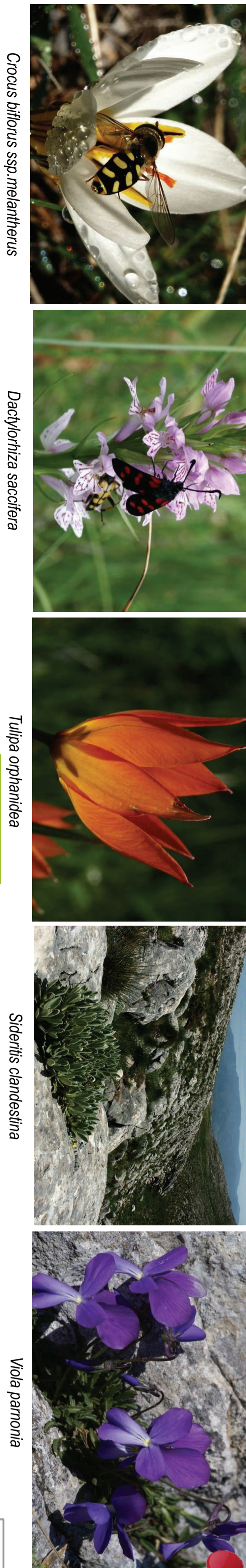
Ορισμός Chrysobothris sp. meliboeus , Dactylopsila sacchara , Tilia sp. sp. , Stachys caryophylla , Viburnum sp.