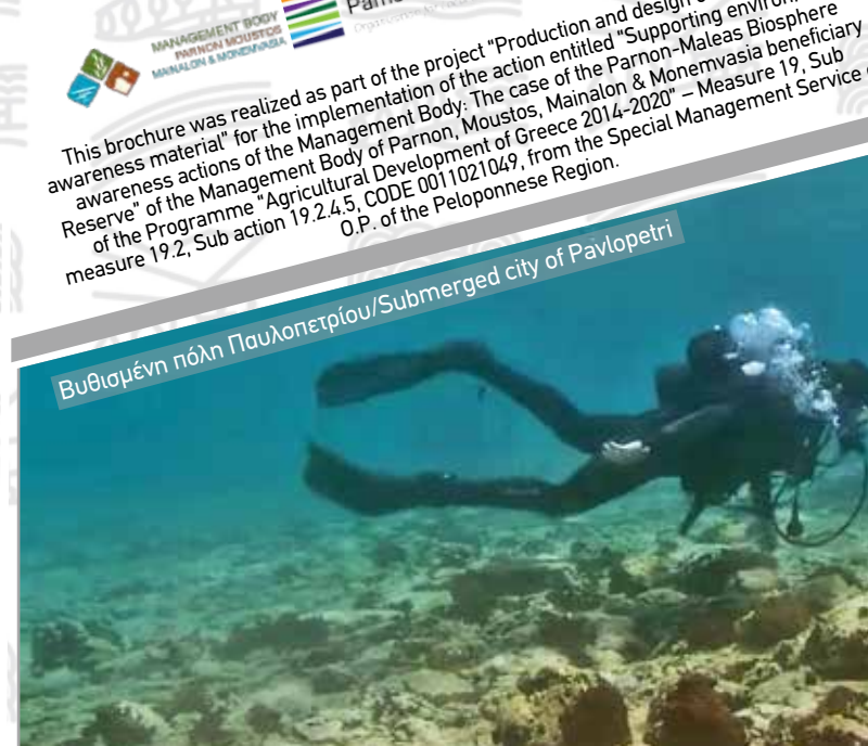
Βυθισμένη πόλη Παυλοπετρίου/Submerged city of Pavlopetri