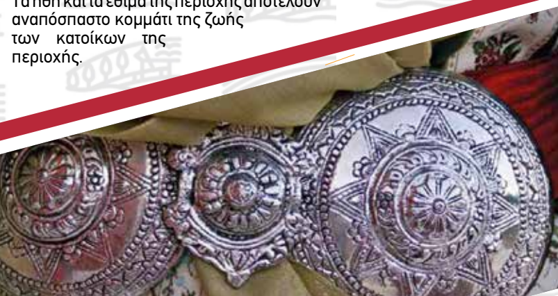
Τσακωνική φορεσιά (λεπτομέρεια)/Tsakonian costume (detail)