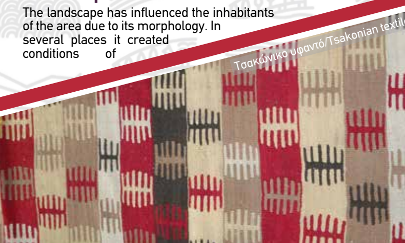
Τσακωνικό υφαντό/Tsakonian textile

Η πολιτιστική κληρονομιά του Αποθέματος Βιόσφαιρας